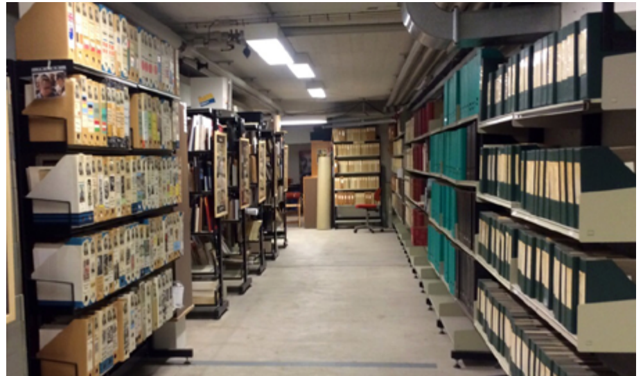
Frederikshavn Sanat Müzesi ve Ekslibris Koleksiyonu