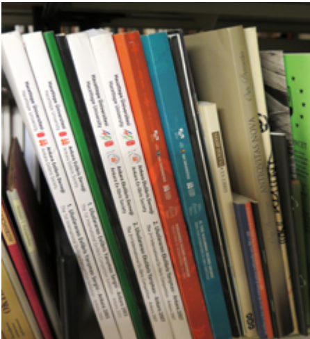
Müze kütüphanesinde Türkiye'den kataloglar