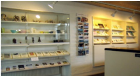
Kitap ve hediyelik satış bölümü