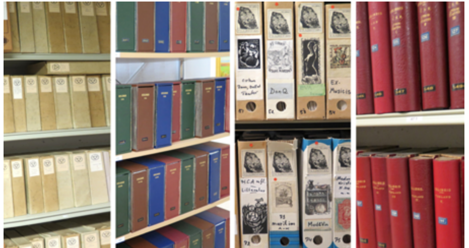
Bağışlanan ekslibris grupları ve kutuları