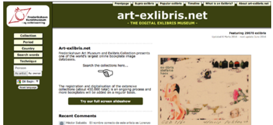
art-exlibris.net dijital ekslibris müze arayüzü