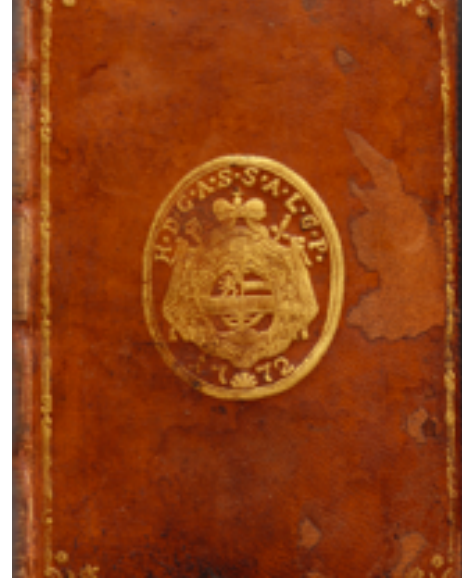
Görüntü 5: İsmi ilk harfleri ve soyadın yazılı olduğu armalı süper ekslibris