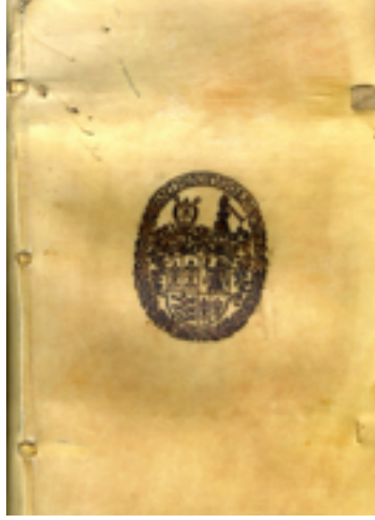
Görüntü 4: Kapak içine damgalanmış süper ekslibris