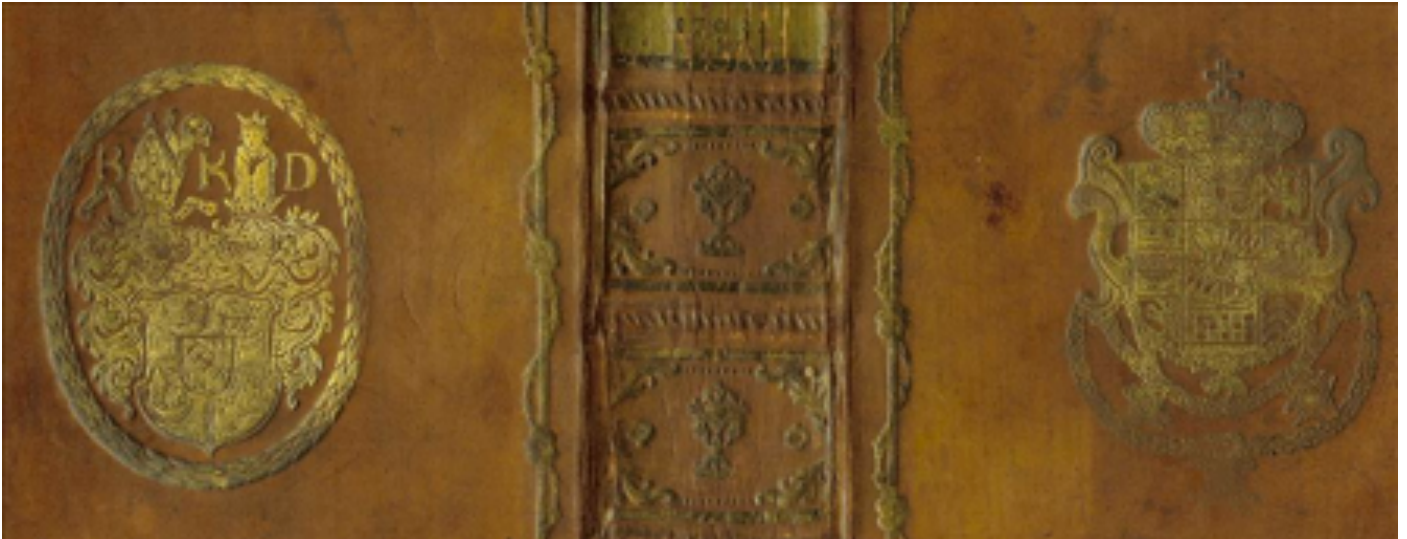
Görüntü 6: Kitap ön kapağı, arka kapağı ve sırtında uygulanmış süper ekslibrisler

Süper ekslibris koleksiyonculuğu değiş tokuş olmaksızın çoğunlukla satın alınarak genişletilmektedir. Bilinen en büyük süper ekslibris koleksiyonu Danimarkalı koleksiyoner Ejgil Jenssen Tusch'un İsveç süper ekslibris koleksiyonudur. Ekslibrisi özellikle bir süper ekslibrisi kitaptan çıkartarak koleksiyonunu yapmak uygun olmasa da, bu günümüzde önüne geçilemeyen bir durumdur (Rödel, 2002:19).