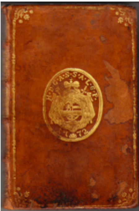
Görüntü 1: 1772 Salzburg başpiskoposu Kont Hieronymus von Colloredo'nun arması olan süper ekslibrisli kitap cildi.