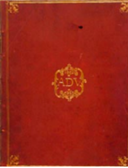
Görüntü 3: Ad soyad ilk harflerinden oluşan süper ekslibris