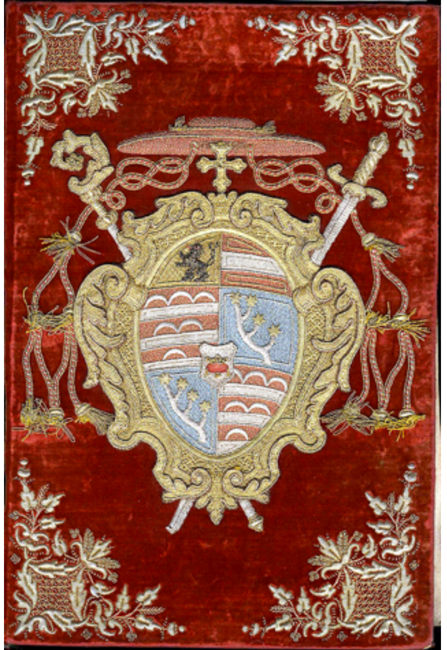
Görüntü 7: Salzburg Üniversitesi Kütüphanesi koleksiyonunda bulunan Leopold Anton Eleutherius von Firmian'a ait süper ekslibrisli kitap.