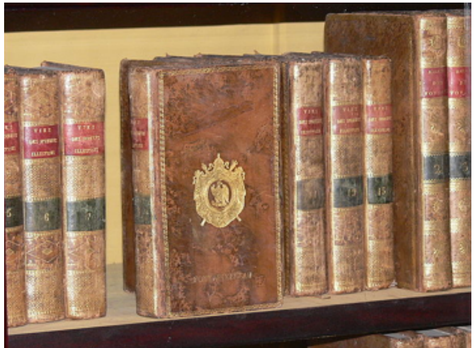
Görüntü 2: Napolyon Bonapart'ın kütüphanesinden super ekslibrisli kitaplar