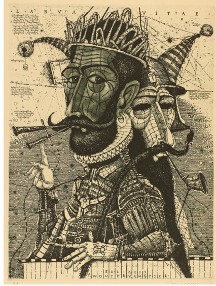
Görsel 10: Oleg Denisenko, mezotint, asitle yedirme, kuru kazıma tekniği ile, Ukrayna, 2002 (Kaynak: Frederikshavn Sanat Müzesi Klaus Rödel Koleksiyonu)