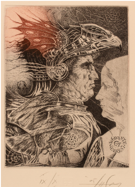
Görsel 6: Luigi Casalino tarafından asitle yedirme tekniği, 17,4 x 12,6 cm, İtalya, 2005

2000 sonrası dönemde, Ukraynalı özgün baskı sanatçılarından Oleg Denisenko'nun eserleri incelendiğinde, geleneksel çukur baskı