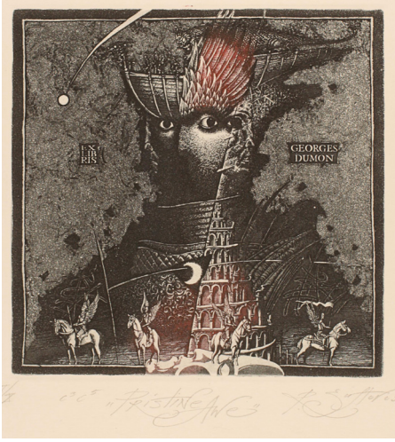
Görsel 3: Roman Nikolaevich Sustov tarafından Aquatinta ve asitle yedirme tekniği ile, 12,8 x 11,9 cm, Beyaz Rusya, 2009

Ekslibris sanatı 19. yüzyılın sonlarına doğru sadece kitabın mülkiyetini belirleyici bağlamında anlandırılmaktan çıkarak bir koleksiyon eseri olarak değer kazanmaya başlamıştır. Konular ve anlatım üslupları çeşitlenmiş, ihtişam göstergeleri sembolik ifadeler yerini doğal içerikli anlatımlara bırakmıştır. “Artık sadece kitaplara yapıştırmak düşüncesiyle yapılmayıp, biriktirme ve değiştirme objeleri olarak da kullanılmaya başlanan ekslibrisler, kitaba özgü bir işaret olmaktan çıkıp, özgün bir grafik çalışma olarak da bağımsızlaşmıştır” (Pektaş, 2017, s.19).