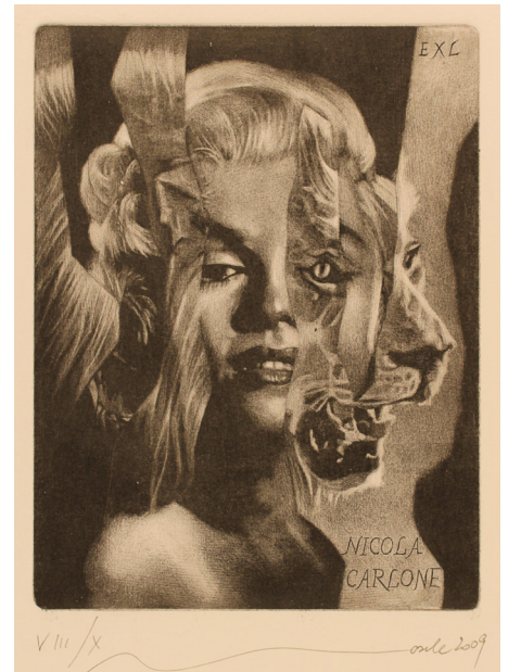
Görsel 8: Ivo Mosele, Mezotint Tekniği ile, İtalya, 2009