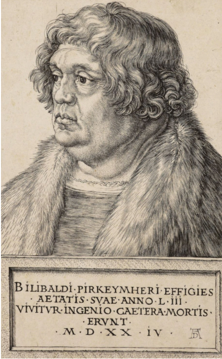
Görsel 1: Albrecht Durer, 1524, Royal Collection, Gravür, 11,4 x 8,0 cm, 1524

Ekslibris kitapların iç kısmına yapıştırılarak kitap sahibinin ya da kütüphanesinin kimliğini ifade eden sanatsal yorumla üretilmiş baskı resim ürünleridir. Kitap boyutları gözetilerek hazırlandıklarından küçük boyutludurlar. Kişisel kitaplıklardan ya da kütüphanelerden ödünç alınan kitapların sahibine geri dönmesi için hatırlatma işlevine sahip bu sanatsal yaratılar, ekslibrisi tasarlayan sanatçının özgün ve yaratıcı anlatım dili ve teknik yaklaşımı ile kitabın sahibini tanıtır (Pektaş, 2017, s.11).