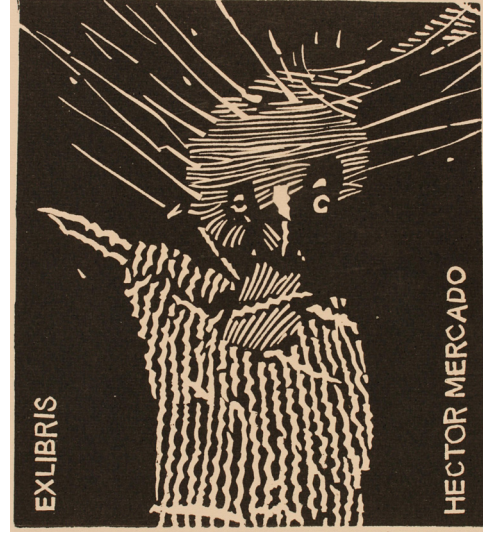
Görsel 14: Lukasz Cywicki, linolyum tekniği ile, Polonya, 2011

pozitif ilişkisi ile anlatım güçlü kılınmıştır. (Bkz. Görsel 9). Portre kullanımına yönelik çalışmalarında asitle yedirme tekniğini kullanan günümüz önemli Bulgar sanatçıları arasında Peter Velikov, Hristo Naidenov ve 2016 yılında genç yaşta yaşamını yitiren Edward Penkov'un yeri büyüktür.