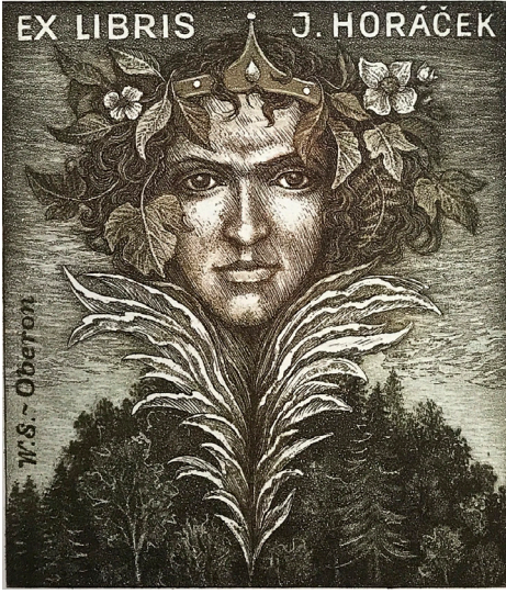
Görsel 12: Peter Melan tarafından, asitle yedirme ve akvatinta tekniği ile, Çek Cumhuriyeti, 2002