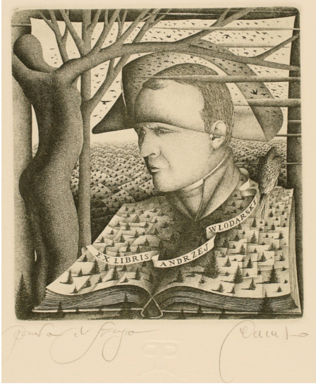
Görsel 5: Pietro Paolo Tarasco, asitle yedirme tekniği ile, İtalya, 2000, (Kaynak: Frederikshavn Sanat Müzesi Koleksiyonu)

Bir başka günümüz İtalyan özgün baskı sanatçısı Erica Forneris'in, çalışmalarında asitle yedirme tekniğini gerçekçi fotoğrafik anlatımlı portreler oluşturmak için kusursuz bir şekilde kullandığı görülmektedir. Gündelik hayattan alınmış karelerden esinlenilmiş ve doğal güneş ışığının etkisi gerçekçi bir dil ile vurgulanmıştır.