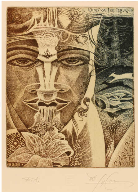
Görsel 7: Luigi Casalino, asitle yedirme tekniği ile, 19,1 x 13,7 cm, İtalya, 2005 (Kaynak: Frederikshavn Sanat Müzesi Koleksiyonu)