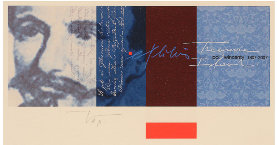
Görsel 17: Martin R. Baeyens, bilgisayarda tasarım tekniği ile, 4,6 x 8,5 cm, Belçika, 2007