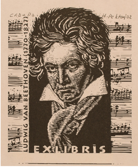
Görsel 18: Hasip Pektaş, (Evrensel Ekslibris) bilgisayarında tasarım ve ofset baskı tekniği ile CGD+P7, 9,5 x 7,9 cm, Türkiye, 2002 (Kaynak: Frederikshavn Sanat Müzesi Koleksiyonu)

Türk ekslibris sanatına katkıları ve öncü rolü ile akademisyen Prof. Hasip Pektaş, Türkiye'nin en önde gelen ekslibris sanatçılarından. Bu alana ilgi duyan sayısız öğrenciler yetiştirerek, ulusal ve uluslararası önemli ekslibris etkinliklerine imzasını atarak, Türkiye'de bu sanat dalının duyulmasını ve yaygınlaşmasını sağlarken yeni ekslibris sanatçılarının doğmasında öncü olmuştur. Çok çeşitli geleneksel baskı tekniklerini eserlerinde özgün bir anlatım dili ile kullanmasının yanında, bilgisayarda tasarım (CGD) tekniğinde de gerçekleştirdiği çalışmaları ile dikkat çekmektedir. (Bkz. Görsel 18).