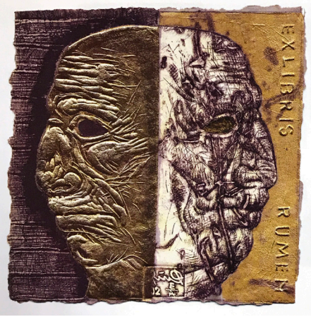
Görsel 9: Rumen Netschev, karışık baskı tekniği ile, Bulgaristan, 2002 (Kaynak: Hacettepe Üniversitesi / AED (2003) 1. Exlibris Yarışması Sergi Kataloğu, Ankara)