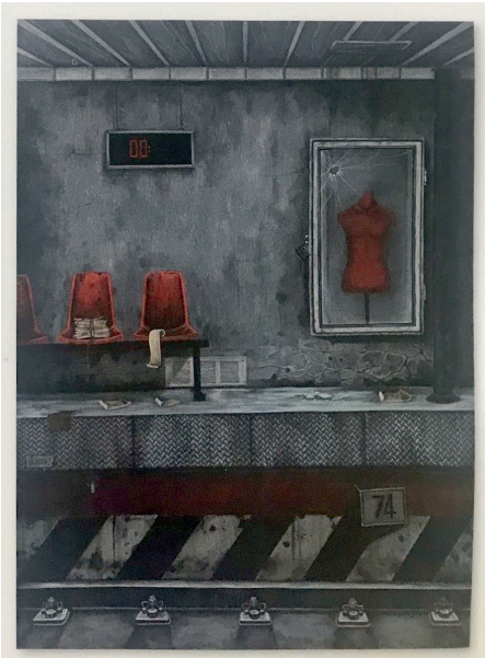
Resim 2: Hedieh Jafari, "Empty Station", Tuval üzerine akrilik. (120x100 cm), 2018

Hedieh'in muhteşem mezzotintleri, tamamen kişisel çıkar ve kişisel çıkar peşinde koşan, suyu, havayı, bitkileri ve hayvanları kontrol etmek isteyen kibirli insana karşı şiirsel bir isyandır, zaferdir. Hedieh'in yapıtı, izleyiciyi insanın doğal ortamındaki mevcut tehlikeli durumu üzerinde düşünmeye teşvik ediyor ve insan davranışını sonsuz paradokslarıyla karşı karşıya getiriyor (Resim 2).