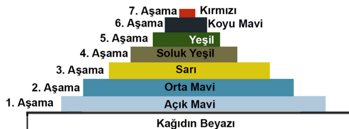
Tablo 4. Görsel 14'te Bulunan ve 7 Aşama Halinde Çalışılan 8 Renkli Eklibris Çalışmasına Ait Renk Piramidi.

Yedinci aşamada ana kalıpla ilgili bir işlem yapılmamıştır. Sanatçı resimde yer alması gereken 'Eks. B. Doğan' yazısını serigrafi tekniği ile aynı kağıtların üzerine basmış ve çalışmayı tamamlamıştır. Aşamalı renkli ağaç baskı tekniği (X1) ve Serigrafi Baskı (S1) tekniği ile yapılan bu çalışmaya ait olarak Tablo 4'te açıktan koyuya doğru sıralanan beyaz, açık mavi, orta mavi, sarı, soluk yeşil, normal yeşil, koyu mavi ve kırmızı renklerin oluşturduğu renk katmanları görülmektedir.