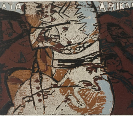
Görsel 13: Nilgün Köseoğlu, “Ekslibris Ata Arıkan”, 2022, X1 (Yüksek- Ağaç Baskı), 9x12 cm.

Böylece dört aşamada açık kahve, kırmızı, mavi ve siyah renkler resme basılmış, kağıtın kendi beyaz rengi de resme dahil edildiğinden 5 renkli bir aşamalı oyulmuş ekslibris çalışmasına (X3) ulaşılmıştır. Açıkta koyuya doğru üst üste binmiş beş renkten oluşan resimde, her aşamada geriye daha az miktarda tümsek kalmış ve Tablo 2’de görüldüğü gibi ortaya bu renk piramidi çıkmıştır.