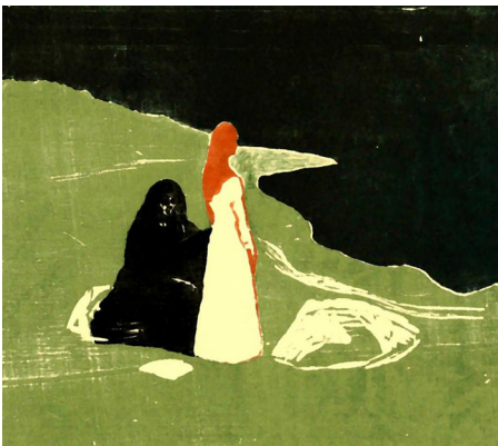
Görsel 2: Edvard Munch, “İki Ksdın”, 1896, Ağaç Baskı, 46,5 x 37,5 cm.

20. yüzyılın başında Almanya’da modern sanat süreci içinde sanatçıların ve düşünürlerin Rönesans Almanya’sına tekrardan dönerek yeni bir üslup arayışı sonucunda Dürer’in ahşap baskılarına eğilim artmıştır. Ancak eskiden olduğu gibi bürin aleti yerine yeni oyma aletleri kullanılması, şimşir gibi hassas ağaç kalıplar yerine damarlı ve sert ağaç kalıpların kullanılmasıyla birlikte ahşap üzerinde aşırı detaylı çizgiler yerine daha sert, daha kaba ve hızlı sonuca gidilmiş çizgiler oluşmaya başlamıştır. Dönemin sanatsal düşüncesine uygun olarak bu eyleme dışavurumculuk (ekspresyonizm) denmiştir. Norveçli sanatçı Edvard Munch (1863 - 1944) ekspresif ifadeye ön plana çıkmış eserler üretmiş, bunların arasında ahşap oyma resimler de yapmıştır (Görsel 2).