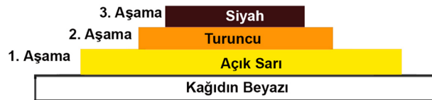
Tablo 5. Görsel 15'de Bulunan ve 3 Aşama Halinde Çalışılan 4 Renkli Ekslibris Çalışmasına Ait Renk Piramidi.

Siyah renk resimde en üstte kullanılan son renktir. Turuncudan sonra en çok yeri kaplamaktadır. Sağdaki pencereden gelen ışığın aksine mekan içini karanlık bir atmosfere dönüştürerek sinema izleme ediminin oluşmasını sağlamaktadır. Ayrıca 'Exlibris' yazısı ve 'M. Tüzün' yazısı da siyah renktedir ve bu sayede mekan içinde kolayca algılanmaktadırlar. Aşamalı Renkli Linolyum Baskı (X3) tekniği ile yapılan bu ekslibris çalışmasına ait renk katmanları Tablo 5'deki piramit yapıda görülmektedir.