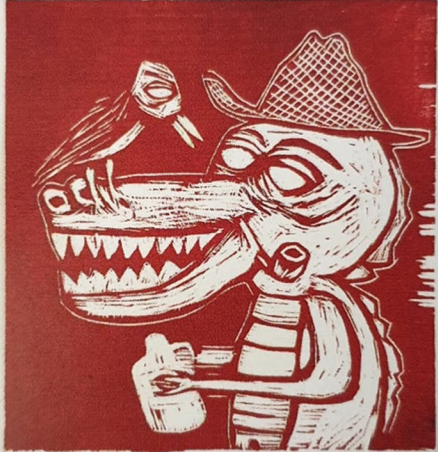
Görsel 8: Tasarımda mavi olan alanlar dördüncü aşamada kalıp üzerinde oyulmuş ve dördüncü renk olarak kırmızı boya merdane yolu ile kalıbın yüzeyine yüklenmiş ve ardından da boş kağıda basılarak bu aşamanın durumu gösterilmiştir.