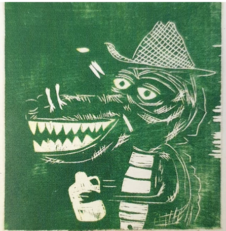
Görsel 6: Tasarımda sarı olan alanlar ikinci aşamada kalıp üzerinde oyulmuş ve ikinci renk olarak yeşil boya merdane yolu ile kalıbın yüzeyine yüklenmiş ve ardından da boş kağıda basılarak bu aşamanın durumu gösterilmiştir.

Ekslibris sanatında ise yüksek baskıya genel olarak 'X' kodu yazılır. X harfi Xylographie'den yani yüksek oyma baskı manasından gelir. Yüksek baskı kapsamında bulunan Ahşap Baskı için 'X1', Ahşap Oyma Baskı için 'X2' ve Linolyum Baskı için de 'X3' kodlaması kullanılır. Ayrıca metal oyma yapıp da yüksek alandan boya alındığında 'X4', yine metal oyma yapıp da hem çukurdan hem de tümsekten boya alındığında 'X5', Plastik alaşım malzeme oyulup da yüksek alanlarından baskı alındığında 'X6', taş oyularak yüksekten baskı alındığında da 'X8' kodlaması verilir.