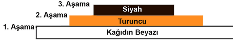
Tablo 1. Görsel 11’de Bulunan ve 2 Aşama Halinde Çalışılan 3 Renkli Ekslibris Çalışmasına Ait Renk Piramidi.

Üçüncü aşamada ise resimde turuncu olması gereken alanlar kalıp üzerinden oyularak çıkartılmıştır. Oyma işlemi tamamlandıktan sonra yüzeye siyah renk boya verilmiş ve aynı kağıtlara baskıları alınmıştır. Açıkta koyuya doğru üst üste binmiş üç renkten oluşan resimde, her aşamada geriye daha az miktarda tümsek kalmış ve Tablo 1’de görüldüğü gibi ortaya bu renk piramidi çıkmıştır.