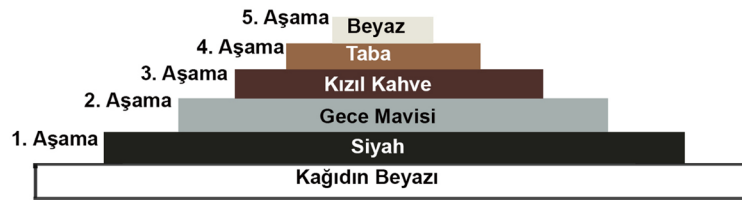
Tablo 3. Görsel 13'te Bulunan ve 6 Aşama Halinde Çalışılan 7 Renkli Ekslibris Çalışmasına Ait Renk Piramidi

Aşamalı renkli ağaç baskı (X1) tekniği ile yapılan bu çalışma beş aşamada yapılmış, ilk aşamada oyulan yerdeki yazılarda kalan kağıdın beyazı ile de 6 renkli bir sonuca ulaşılmıştır. Bu renkler alttan yuları sırası ile kağıdın beyazı, siyah, gece mavisi, kızıl kahve, taba ve beyaz renklerdir. Çalışmadaki renk sıralaması Tablo 3'te gösterilmiştir.