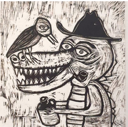
Görsel 9: Tasarımda kırmızı olan alanlar beşinci aşamada kalıp üzerinde oyulmuş ve beşinci renk olarak siyahı boya merdane yolu ile kalıbın yüzeyine yüklenmiş ve ardından da boş kağıda basılarak bu aşamanın durumu gösterilmiştir.

kağıt sayısı biraz daha artırılır. Tasarım kalıba aktarılır ve birinci aşamada resimde beyaz olacak yerleri oyma aletleri ile oyarak kalıptan çıkartılır. Görsel 5'de yer alan örnekte görüldüğü gibi kalıp üzerinde tasarıma ait beyaz alanları oyulmuş ve ilk renk olan sarı boya merdane yolu ile kalıbın yüzeyine yüklenmiş ve ardından pres yolu ile kağıda basılmıştır. Birinci aşamanın sonunda kağıt üzerinde sadece beyaz alanlar net şekilde algılanır.