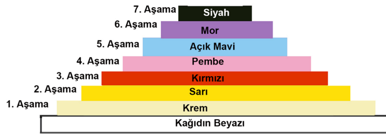
Tablo 6. Görsel 16'da Bulunan ve 7 Aşama Halinde Çalışılan 8 Renkli Ekslibris Çalışmasına Ait Renk Piramidi.

Sekizinci sırada yer alan siyah renk resimde her yerde görülmektedir. Sanatçı siyah rengi resimde genel olarak yan yana uzun çizgisel yapılarda bırakmış ve siyah renk üstüne geldiği diğer renklerle açık-koyu kontrast ilişkisine girmiştir. Soldaki büyük göz figürünün etrafında da çizgisel olarak yapılanmış ve açık tonlu renklerle kontrast oluşturarak dikkat çekmiştir. Ortadaki köprü gibi alanda da açık mavi renk ile çizgisel olarak buluşmuş ve açık-koyu kontrastı oluşturmuştur. Sağ altta geniş bir alanı kaplayan siyah renk bu sayede genele yaygın olan kıpırtılı dinamizmi dengelemektedir. Aşamalı Renkli Linolyum Baskı (X3) tekniği ile yapılan bu ekslibris çalışmasına ait renk katmanları beyaz, krem, sarı, kırmızı, pembe, açık mavi, mor ve siyah olarak sıralanmıştır. Tablo 6'da ilk renk olan beyazdan son renk olan siyaha kadar olan renklere ait renk piramidi görülmektedir.