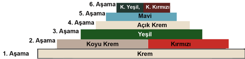
Tablo 7. Görsel 17'de Bulunan ve 6 Aşama Halinde Çalışılan 8 Renkli Ekslibris Çalışmasına Ait Renk Piramidi.

Kalıp üzerinde altı aşama çalışılmış, birinci, üçüncü, dördüncü ve beşinci aşamalarda birer renk, ikinci ve altıncı aşamalarda da ikişer renk kullanıldığı için toplamda 8 renkli bir çalışma elde edilmiştir. Aşamalı Renkli Linolyum Baskı Tekniği (X3) tekniği ile yapılan bu çalışmaya ait renk katmanları Tablo 7'dedir. Birinci katmanda krem, ikinci katmanda koyu krem ve kırmızı, üçüncü katmanda yeşil, dördüncü katmanda açık krem, beşinci katmanda mavi ve altıncı katmanda koyu kırmızı ve koyu yeşil renkleri üst üste görülmektedir.