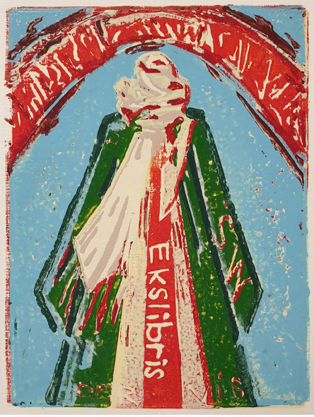
Görsel 17: Mehmet Susuz, “Derviş”, Ekslibris Mehmet Susuz 2022, X3 (Yüksek- Linolyum Baskı), 13X9,5 cm.