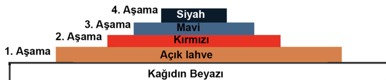
Tablo 2. Görsel 11’de Bulunan ve 2 Aşama Halinde Çalışılan 3 Renkli Ekslibris Çalışmasına Ait Renk Piramidi.

Dördüncü aşamada sol kenardaki mavi renk ile basılan dikey alanın üzerine sanatçı tarafından yazı harfleri çizilerek etraflarında kalan alanlar oyulmuş ve kalıptan çıkartılmıştır. Böylece üçüncü aşamanın sonunda kalıba yüklenen siyah renk bu alanda sadece yazı harflerinde kalmış, yazının ortaya çıkmasını sağlamıştır. Aynı aşamada resmin üzerinde yer alan kuşlarda da az miktarlarda kontur çizgileri ve dar lekeler şeklinde alanlar bırakılarak geri kalan yerler oyularak kalıptan atılmıştır. Siyah renk boya kalıba verilmiş ve önceden üzerine kırmızı ve mavi renk boya basılan kağıtların üzerlerine siyah renkte baskılar alınmıştır.