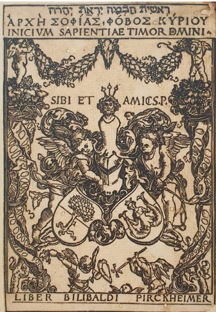
Görsel 1: Albrecht Dürer, “Willibald Pirckheimer için Ekslibris”, 1502, Ahşap Oyma Baskı, 14.9x11.9 cm.

Alman sanatçı Albert Dürer dönemin en tanınan ahşap oyma gravür ressamıydı. Dürer hem kitaplardaki konulara uygun hem de özgün sayılabilecek türde yüzlerce ahşap oyma resimler yapmıştır. Bunların yanı sıra ekslibrisler de yapan sanatçının yüksek baskı tekniği ile ekslibris resim yapan ilk sanatçı olduğu söylenebilir. “Albrecht Dürer’in (1471-1528), 1525 yılına kadar zamanın ünlü devlet ve bilim adamı Willibald Pirckheimer (Görsel 1) ve Hektor Pömer için yirmi bir sayfa ekslibris yaptığı bilinmektedir” (Pektaş, 2017, 16).