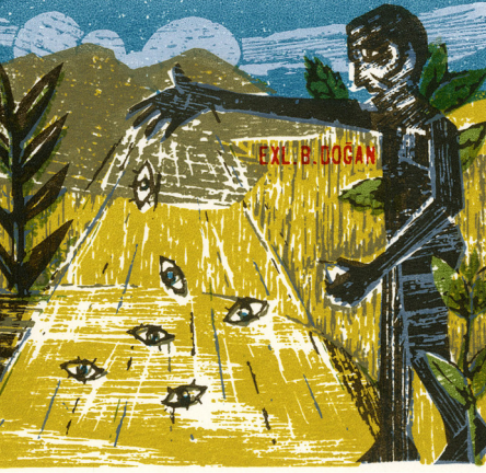
Görsel 14: Ali Doğan, “Ekslibris Bektaş Doğan”, 2010, X1 (Yüksek- Ağaç Baskı), S1 (Serigrafi Baskı), 10x10,5 cm.

Baskı resim üzerine çalışmalar yapan sanatçının yurt dışında ve içinde önemli müzelerde ekslibris çalışmaları bulunmaktadır. Sanatçının çok sayıda yarışmada ödülü bulunmaktadır.