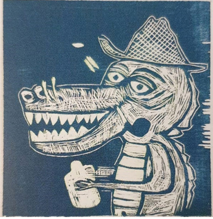
Görsel 7: Tasarımda yeşil olan alanlar üçüncü aşamada kalıp üzerinde oyulmuş ve üçüncü renk olarak mavi boya merdane yolu ile kalıbın yüzeyine yüklenmiş ve ardından da boş kağıda basılarak bu aşamanın durumu gösterilmiştir.