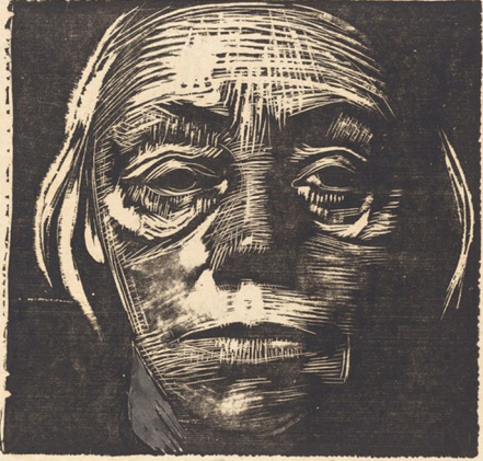
Görsel 3: Kathe Kollwitz, "Otoportre", 1923, Ağaç Baskı Resim, 15x15.6 cm.

önem vermiştir. Oyma aletini detaylara göre değil, biçimin yönüne göre kullanmış, siyahın içinden öne oyma çizgilerinin şekli ile ayrılan portreler yapmıştır (Görsel 3).