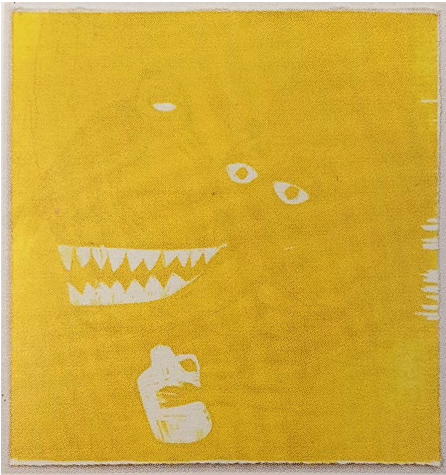
Görsel 5: Tasarımda beyaz olan alanlar birinci aşamada kalıp üzerinde oyulmuş ve ilk renk olarak sarı boya merdane yolu ile kalıbın yüzeyine yüklenmiş ve ardından da boş kağıda basılarak bu aşamanın durumu gösterilmiştir.

Yüksek baskıda ahşap malzeme kullanılırsa teknik detayda 'Ahşap Baskı' tanımlaması, linolyum malzeme kullanılırsa 'Linolyum Baskı' tanımlaması kullanılır. Dünya ülkelerinde ise ahşap malzeme kullanılarak yapılan çalışmalarda genelde 'Woodcut tanımlaması, linolyum malzeme kullanılarak yapılan çalışmalarda da 'Linocut' tanımlaması kullanılır. Eğer renkli çalışma yapılır ve renkler aşamalı olarak elde edilir ise teknik olarak 'Aşamalı Renkli Ahşap Baskı' veya 'Aşamalı Renkli Linolyum Baskı' tanımları kullanılır.