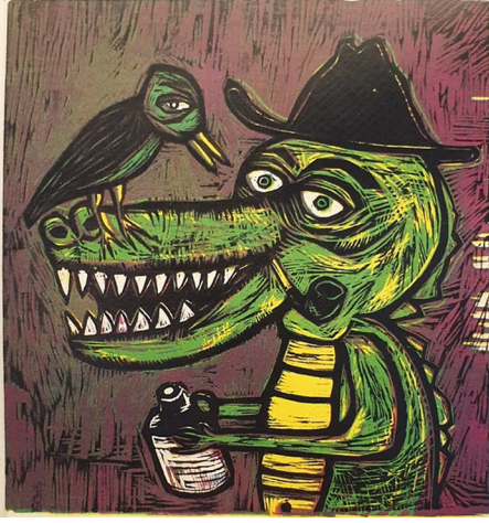
Görsel 10: En altta kağıdın beyazı, üzerinde ilk aşamada basılan sarı, onun üzerinde ikinci aşamada basılan yeşil, onun üzerinde üçüncü aşamada basılan mavi, onun üzerinde dördüncü aşamada basılan kırmızı ve onun da üzerinde son aşama olan beşinci aşamada basılan siyah renklerin bir kağıt üzerinde görülmektedir.

siyah renk olarak seçilir. İlk aşamada kullanılan renk bütün yüzeye yayılır. Sonraki aşamada bu yayılma azalır. Üçüncü ve dördüncü aşamada da renkler öncekilere göre daha az olur. Son aşamada ise artık yüzeyin büyük çoğunluğu oyularak kalıptan çıkartılmış ve siyah için daha az ve çizgisel alanlar bırakılır. Bu sıralama sanatçılar tarafından yapılan deneyimlerle tespit edilmiş ve geleneksel hale gelmiştir. Nadiren de olsa farklı sıralamalı çalışmalar da yapılmaktadır.